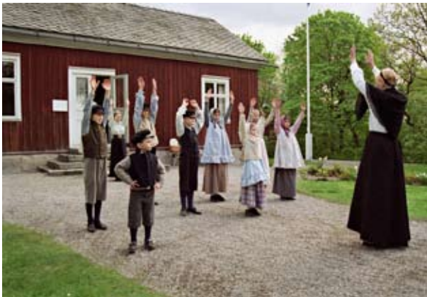
Våla skola byggdes i Västergötland på mitten av 1800-talet. Till vänster om farstun ligger skolsalen och till höger lärarens bostad.