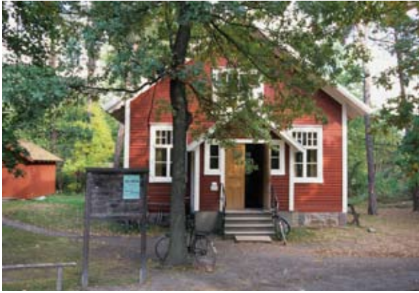
Folkets Hus byggdes 1908 i Ransåters socken i Värmland av Folketshusföreningen, som startades av den socialdemokratiska ungdomsklubben.