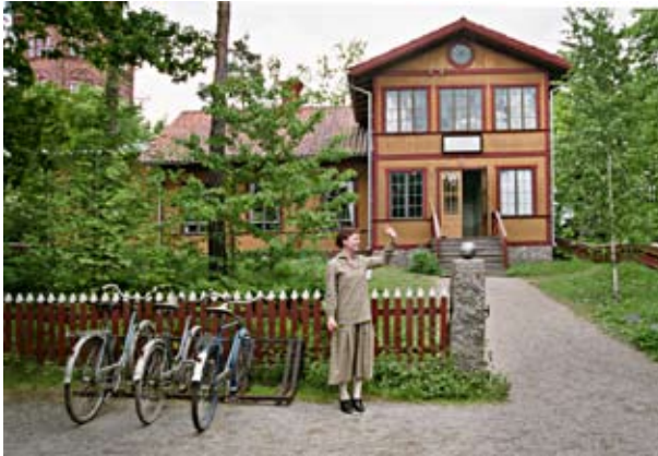
Ordenshuset kommer från Tierp i Uppland. Det byggdes 1895 av nykterhetslogen Brofästet inom IOGT.